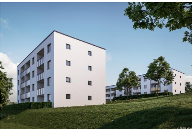
471 Foto Fassade 2.jpg