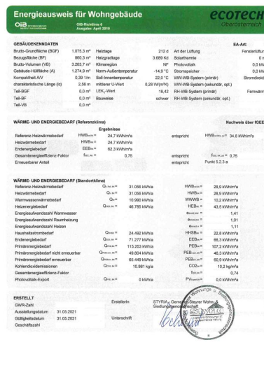
474 Energieausweis St. 2_2.jpg