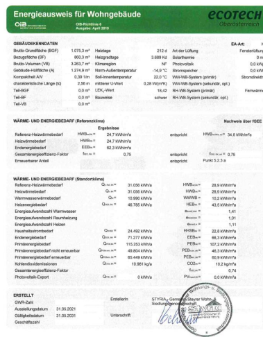
474 Energieausweis St. 2_2.jpg