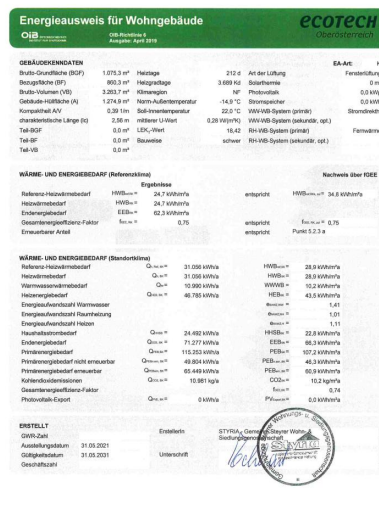
474 Energieausweis St. 2_2.jpg